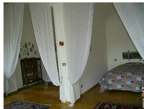
camera del proprietario