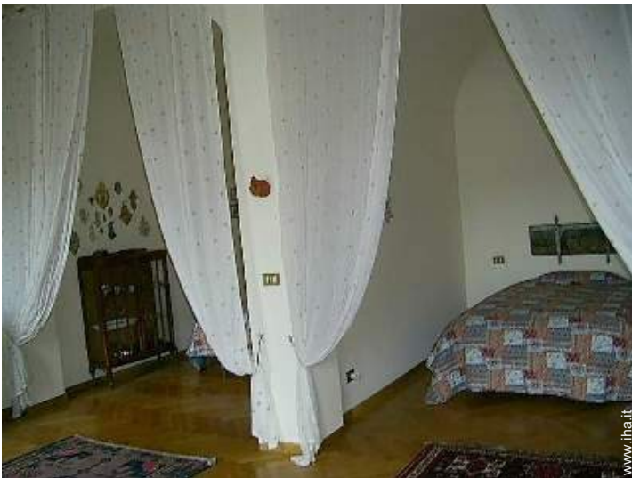
camera del proprietario