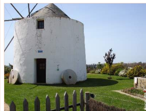
Antico Mulino di Charme