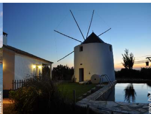
vista sul tramonto