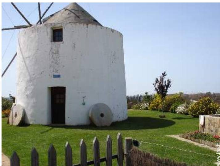
Antico Mulino di Charme