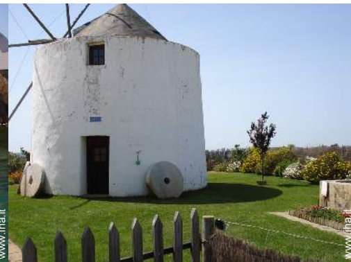
Antico Mulino di Charme