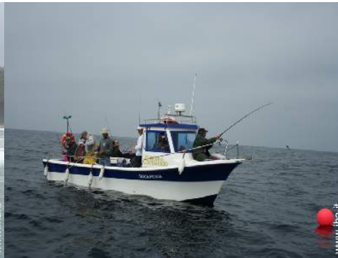
pesca in alto mare