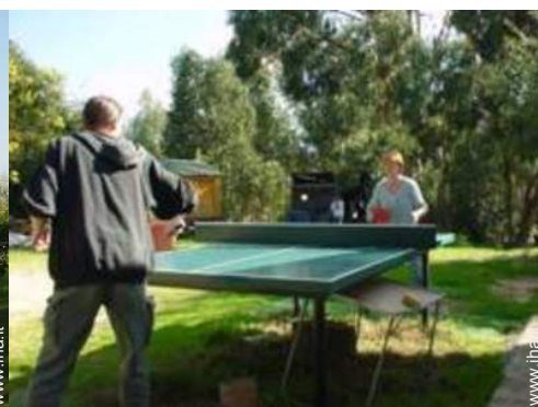
tavolo da ping-pong