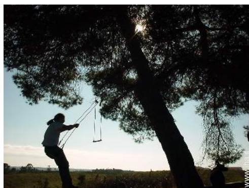
struttura rampicante per bambini