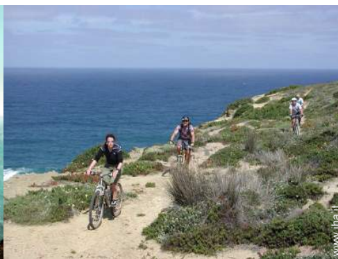
percorso per mountain bike