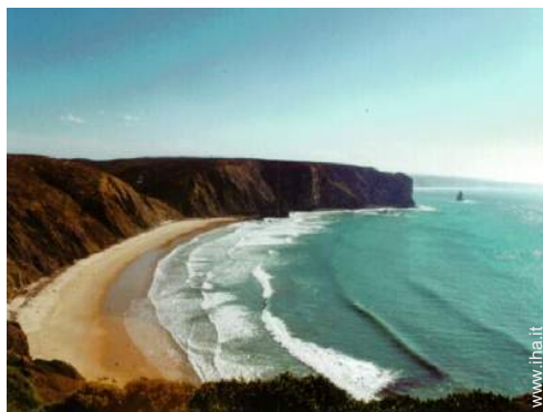
punto di surf