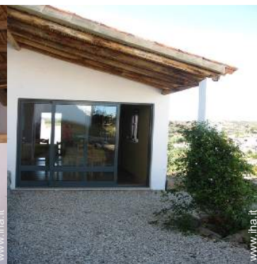
vista dal patio