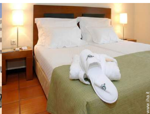
Appartamento di Charme