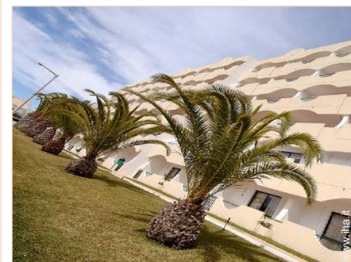
Appartamento di Charme