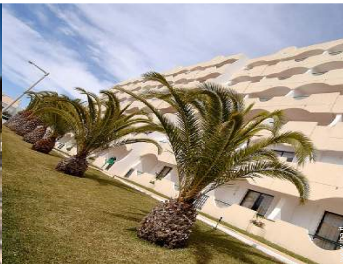
Appartamento di Charme