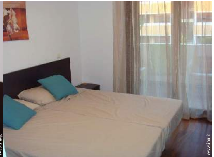
stanza degli ospiti