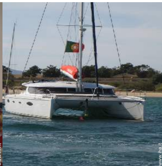
sport estivi nelle vicinanze