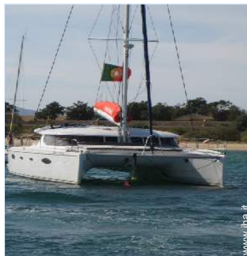
sport estivi nelle vicinanze

Bambini benvenuti Animali ammessi a condizioni (informarsi presso il proprietario) Copertura telefonia mobile, trasporto personale consigliabile Acqua : calda/fredda Tensione elettrica : 220V / 60Hz Alimentazione elettrica : conduttura