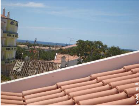
vista dalla terrazza sul tetto