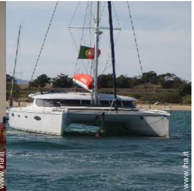
sport estivi nelle vicinanze