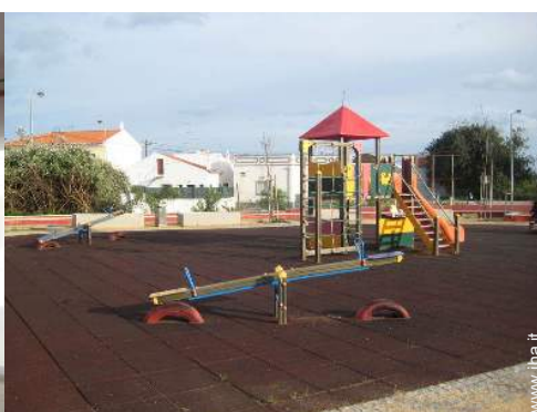
parco dei divertimenti