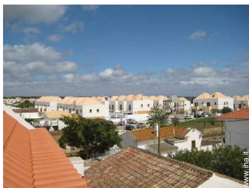
vista dalla terrazza sul tetto