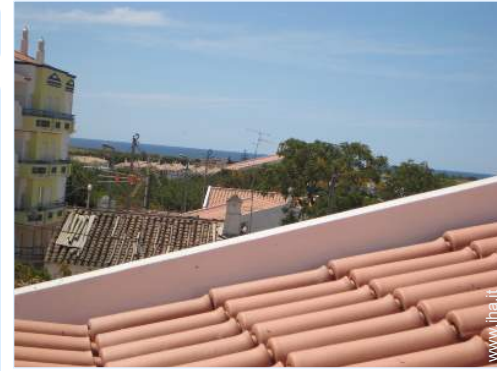
vista dalla terrazza sul tetto

Salotto estivo, barbecue, tavolo da giardino, 8 sedia(e) da giardino, ombrellone, salotto da giardino, 2 sedia sdraio, doccia esterna