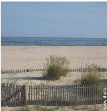
sport estivi nelle vicinanze