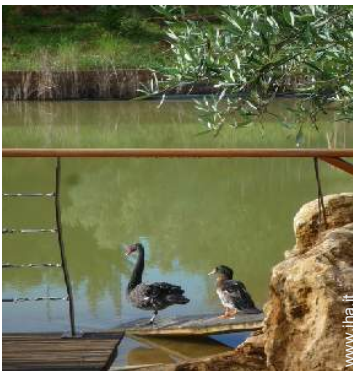
Presenza sul posto