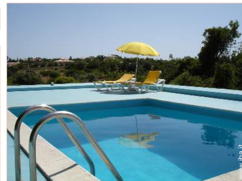
sistema di illuminazione