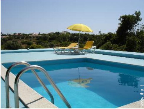
sistema di illuminazione