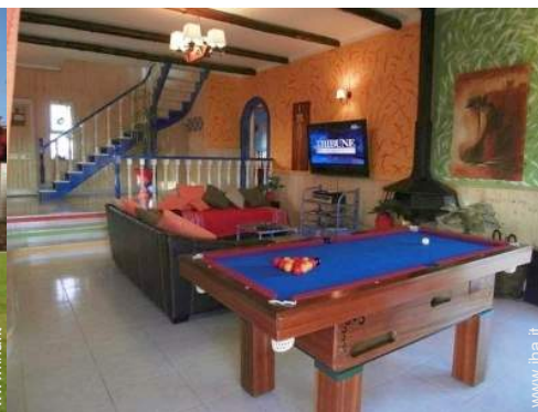
tavolo da biliardo