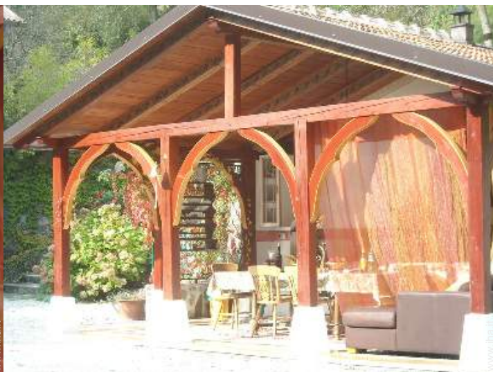
sala di musica