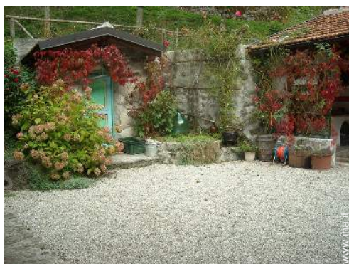
cantina e degustazione di vino