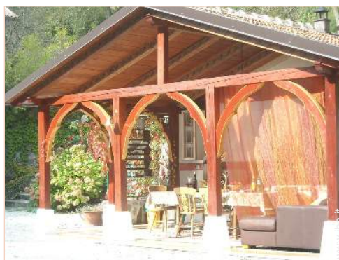
sala di musica