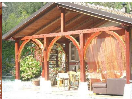
sala di musica