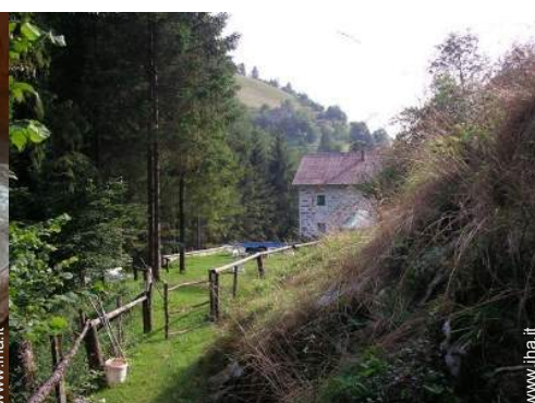
vista sulla foresta