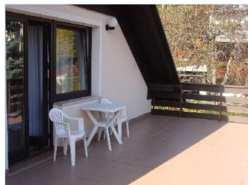
terrazzo sul tetto