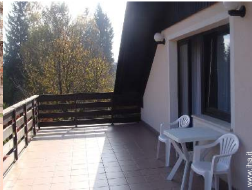
terrazzo sul tetto