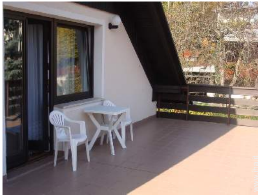
terrazzo sul tetto