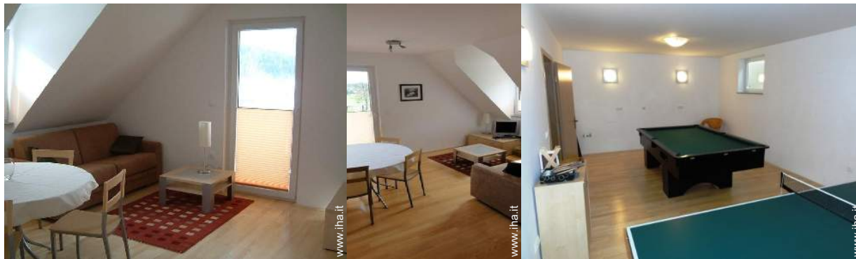
sala dei giochi