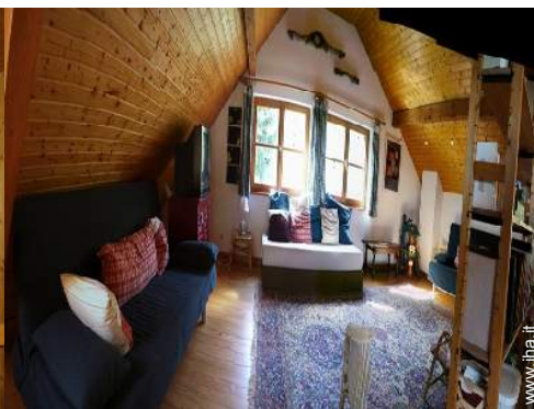
attrezzo(i) per il fitness