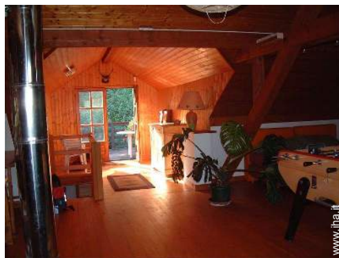
sala dei giochi