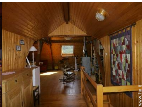
sala dei giochi