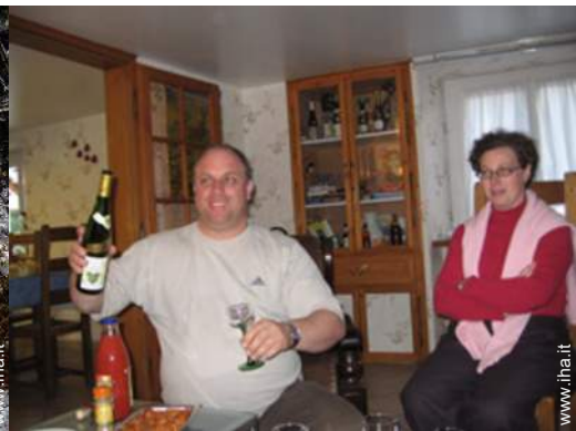
I vostri ospiti