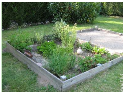
vasca per la sabbia