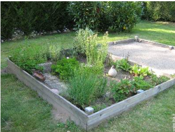
vasca per la sabbia