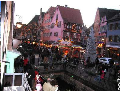
vista sulla piazza