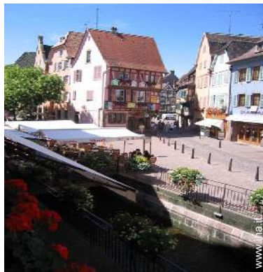
vista sulla strada pedonale