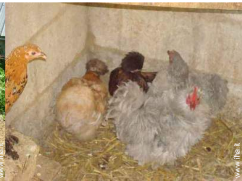
animali da fattoria