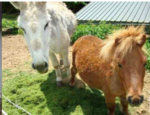
animali da fattoria