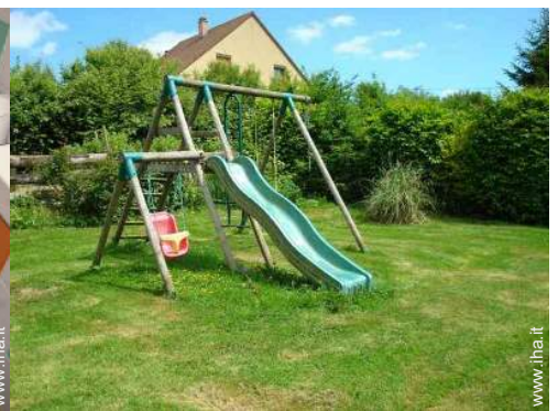
Installazione esterna a disposizione degli ospiti