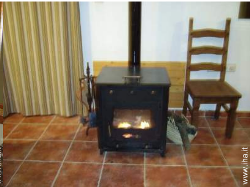
stufa a legna