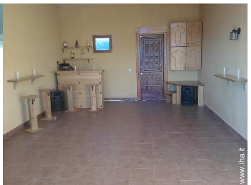
sala di musica