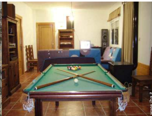
tavolo da biliardo