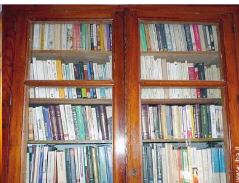
collezione di libri