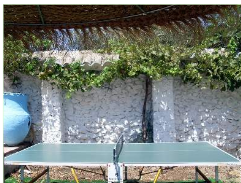
tavolo da ping-pong