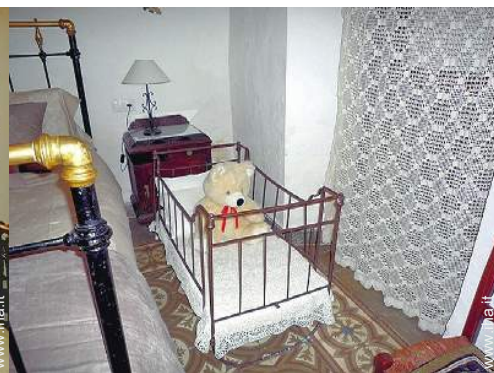
letto (i) bambino