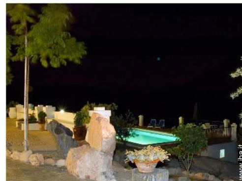
sistema di illuminazione