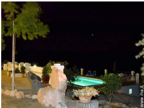
sistema di illuminazione