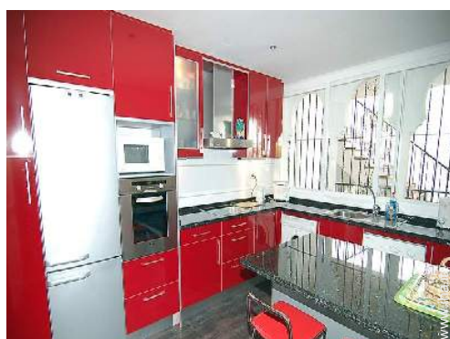
grande cucina indipendente