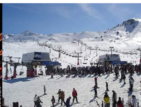
piste di sci