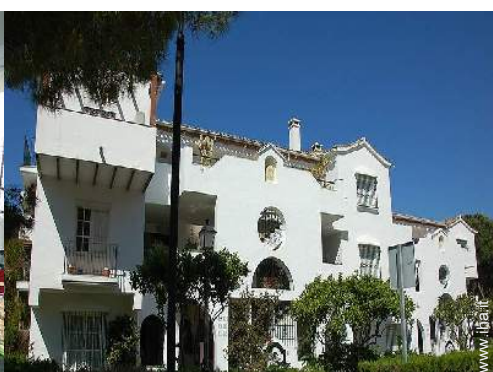
Residenza di Charme