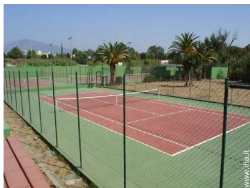
Tennis - superficie dura