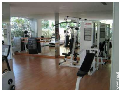
attrezzo(i) per il fitness