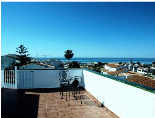
vista sui tetti