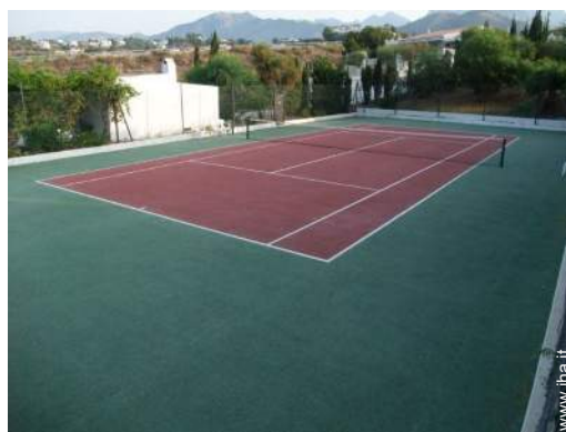
Tennis - superficie sintetica