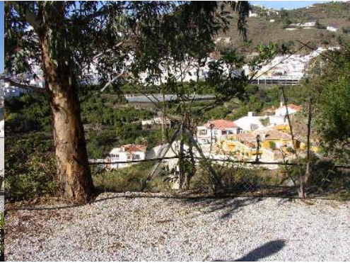
vista sul villaggio