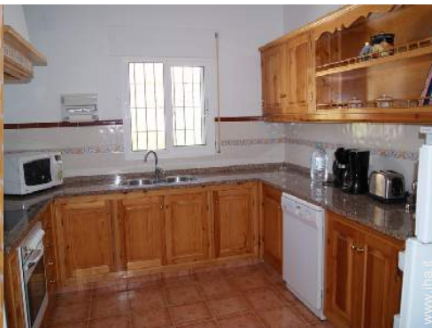
grande cucina in stile americano