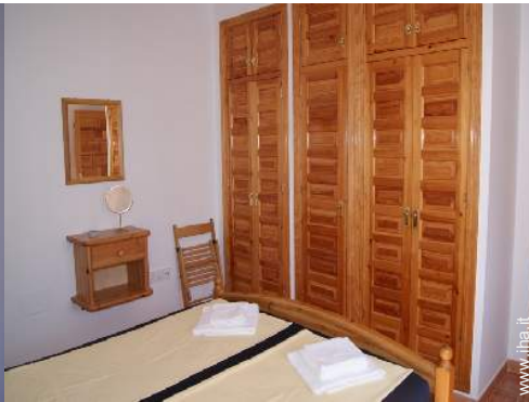
Comfort interno ed attrezzature