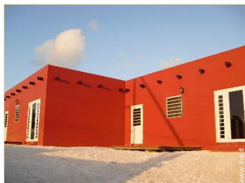
Appartamento di Prestigio

Privilegi : Accesso diretto alla spiaggia, campo pratica