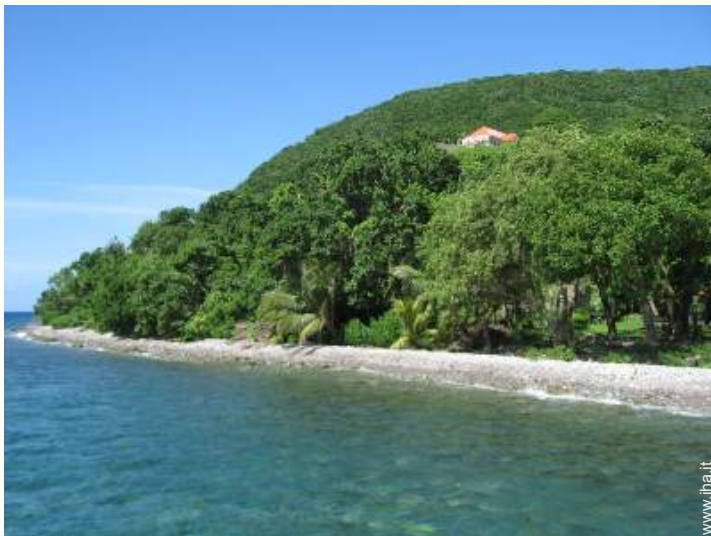
spiaggia con ciotoli