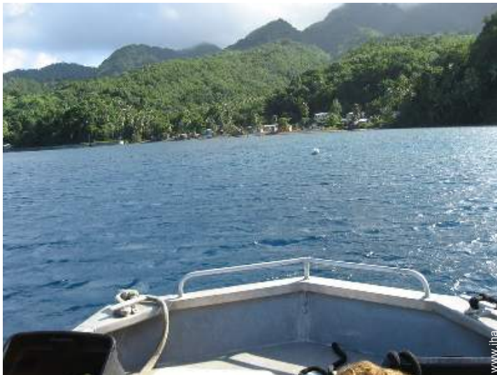
escursione in barca