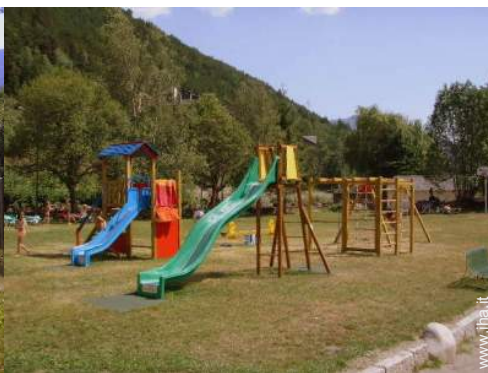
vasca per la sabbia