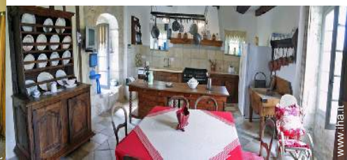
grande cucina indipendente