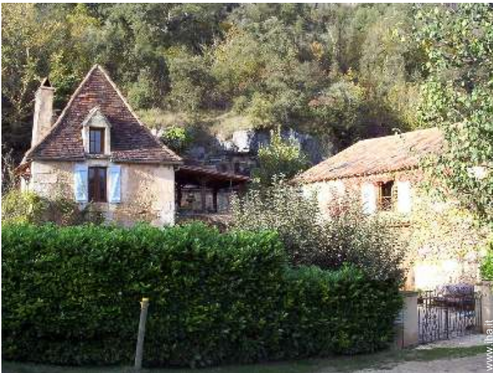
Antica Fattoria di Charme