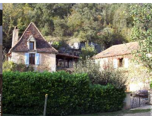
Antica Fattoria di Charme