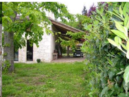
Casa in Pietra di Charme