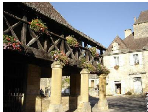
vista sul centro del paese