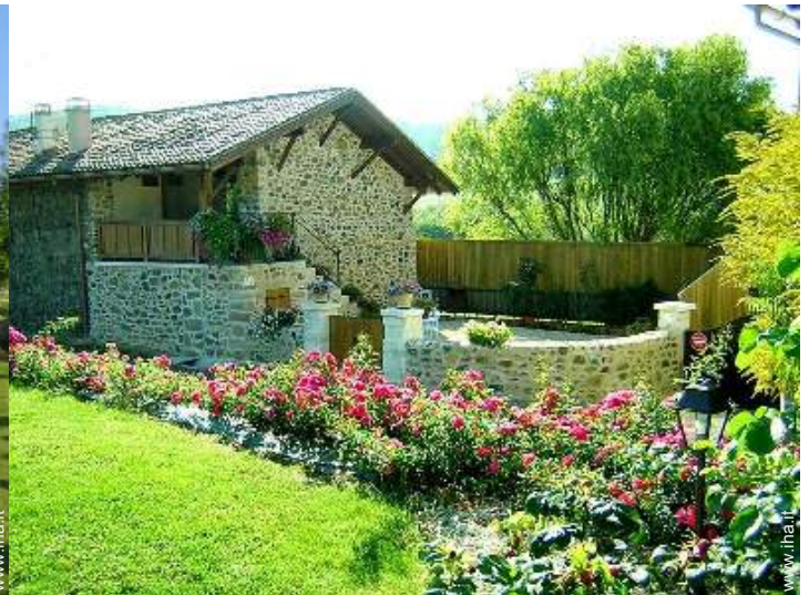
Casa di Charme