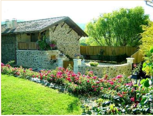
Casa di Charme