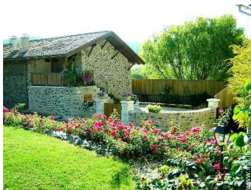
Casa di Charme