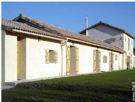
Antico Granaio di Charme