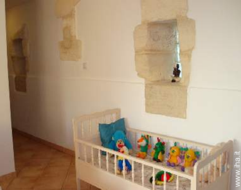
letto (i) bambino