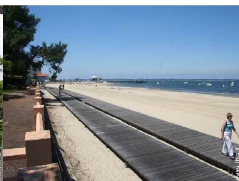
accesso diretto alla spiaggia