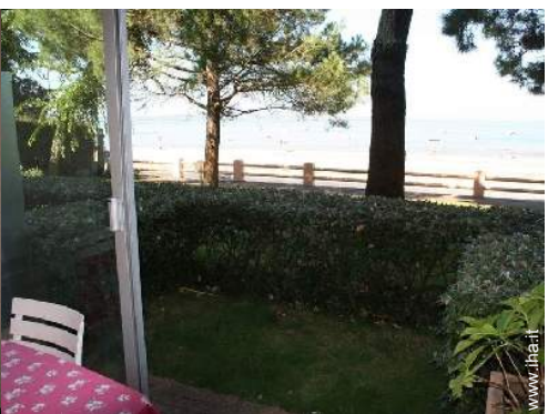
vista dalla veranda