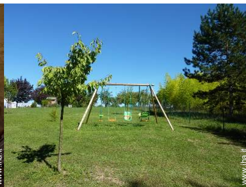
struttura rampicante per bambini