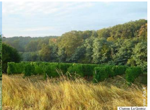
vista sui vigneti