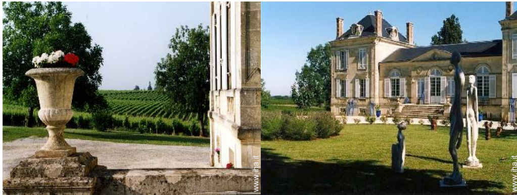
vista sui vigneti