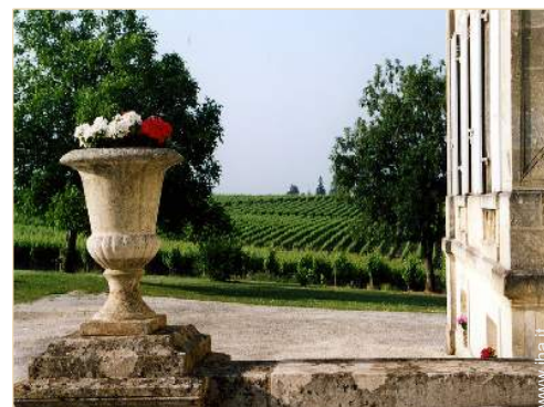
vista sui vigneti

Salotto estivo, barbecue, tavolo da giardino, sedia(e) da giardino, ombrellone, salotto da giardino, 6 sedia sdraio, altalena, struttura rampicante per bambini, doccia esterna