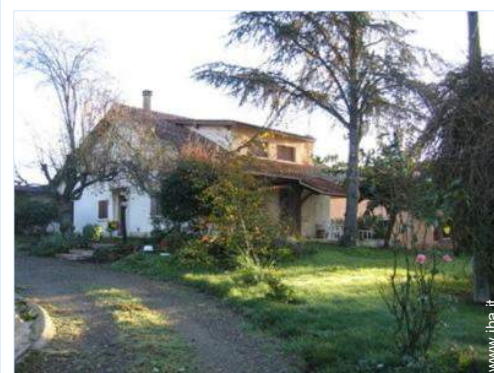
Casa di Campagna

- Negozi tipici 4km - Supermercato 15km - Salone di coiffure 7,5km - Internet café 7,5km - Ufficio postale 7,5km - Banca 7,5km - Distributore automatico di biglietti 7,5km - Farmacia 7,5km - Medico 7,5km - Ospedale 15km