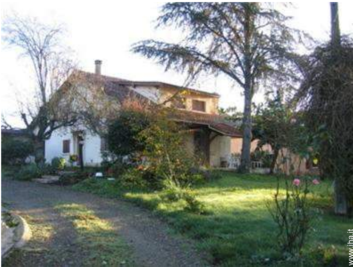
Casa di Campagna