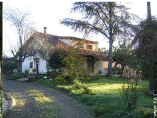
Casa di Campagna