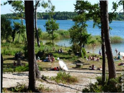
sport acquatici nelle vicinanze