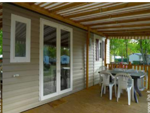
sedia(e) da giardino