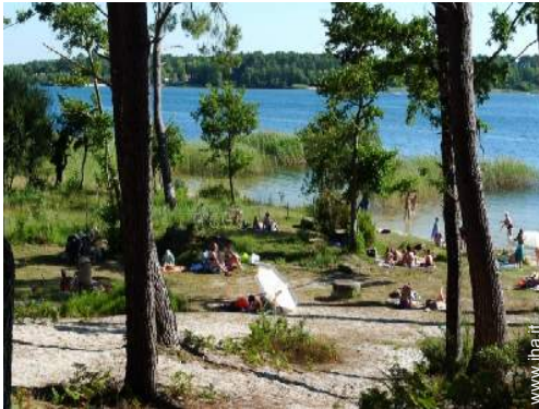
sport acquatici nelle vicinanze