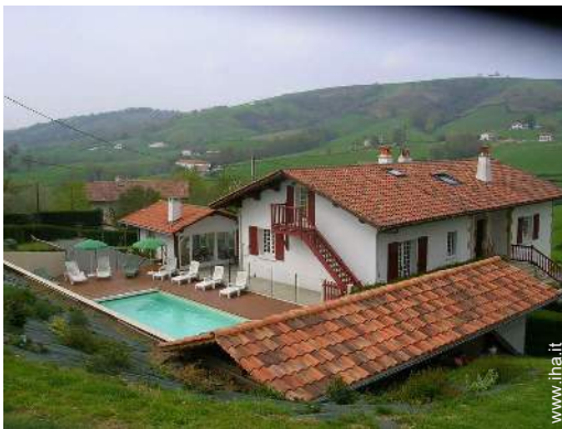
vista sui campi agricoli