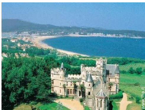
Attrazioni e relax