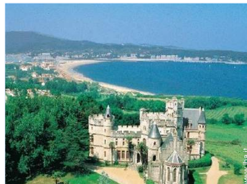
Attrazioni e relax

Cucina esterna, tavolo da giardino, 5 sedia (e) da giardino, ombrellone, 2 chaise(s) longue(s), 1 amaca(che)