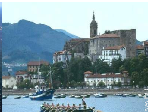
sport estivi nelle vicinanze