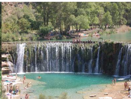
sport estivi nelle vicinanze