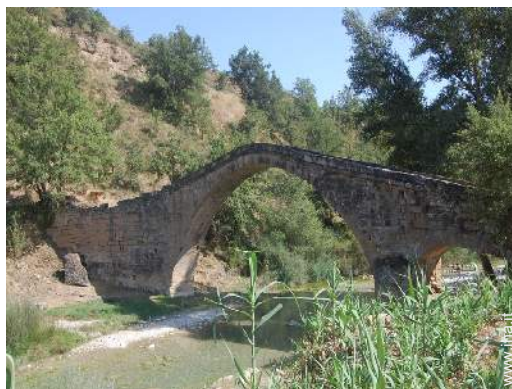
Attrazioni e relax