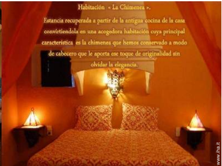
Habitación « La Chimenea ».

Estancia recuperada a partir de la antigua cocina de la casa convirtiendola en una acogedora habitación cuya principal característica es la chimenea que hemos conservado a modo de cabecero que le aporta ese toque de originalidad sin olvidar la elegancia.