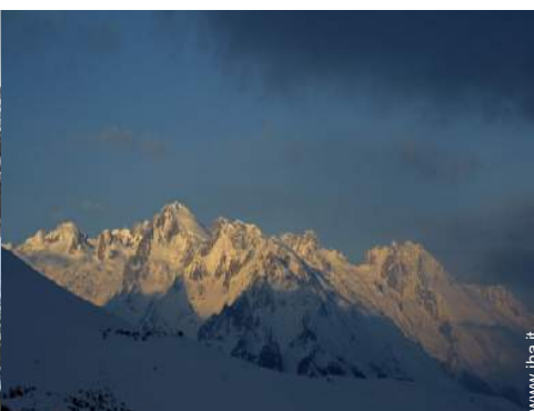
sport invernali nelle vicinanze