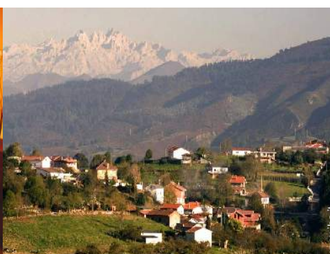
vista sul centro del paese