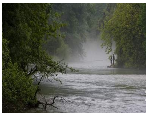
pesca con lenza