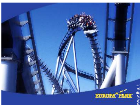
parco dei divertimenti