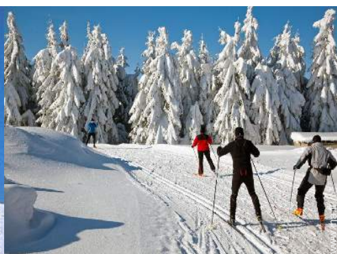
sci di fondo