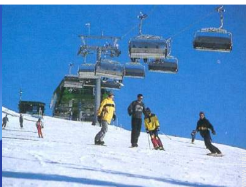
piste di sci