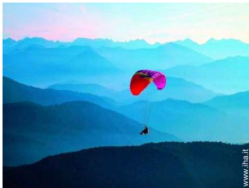
attività di volo nelle vicinanze