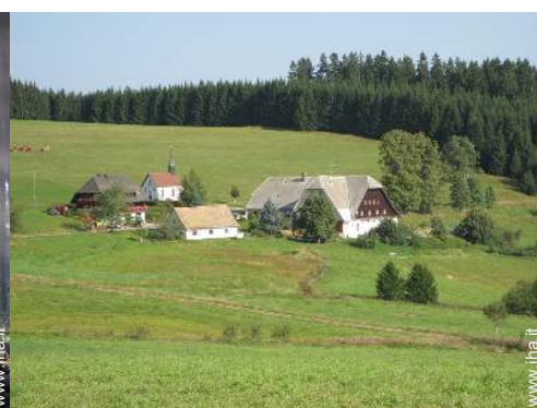
vista sulla campagna