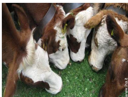
vista sul prato