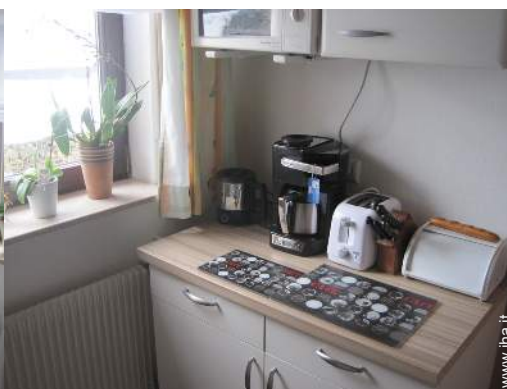
utensili e batteria da cucina