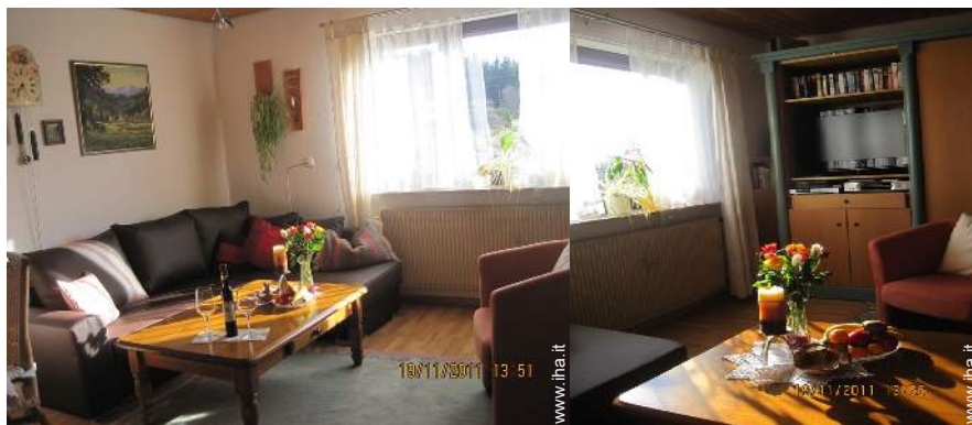
Comfort interno ed attrezzature