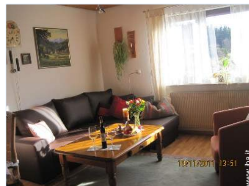
Comfort interno ed attrezzature