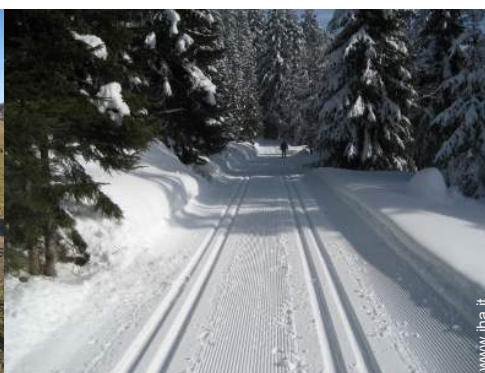
sport invernali nelle vicinanze