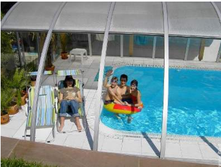
Piscina con acqua di mare