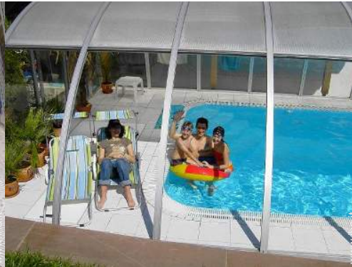
Piscina con acqua di mare