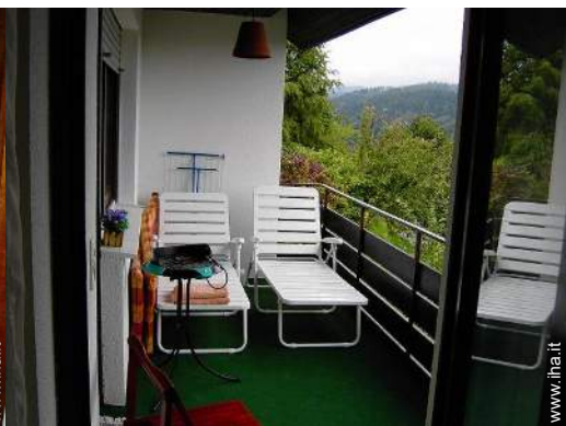
vista dalla loggia