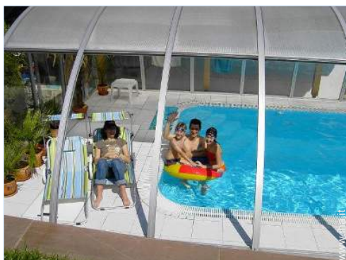
Piscina con acqua di mare