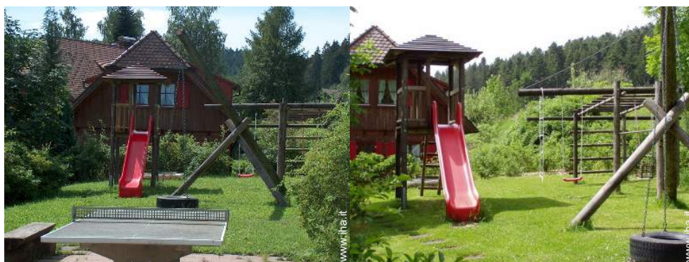
struttura rampicante per bambini