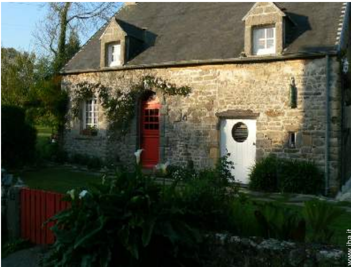
Casa Tipica di Charme