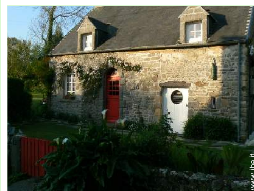
Casa Tipica di Charme